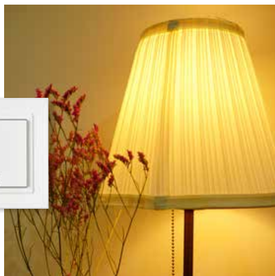
Sensify Funksteckdose und Lichtschalter, über die jede beliebige Lichtquelle kabellos geschaltet werden kann.